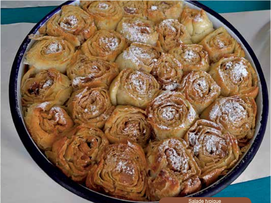
Salade typique (Gourmet Publishing House) ▼