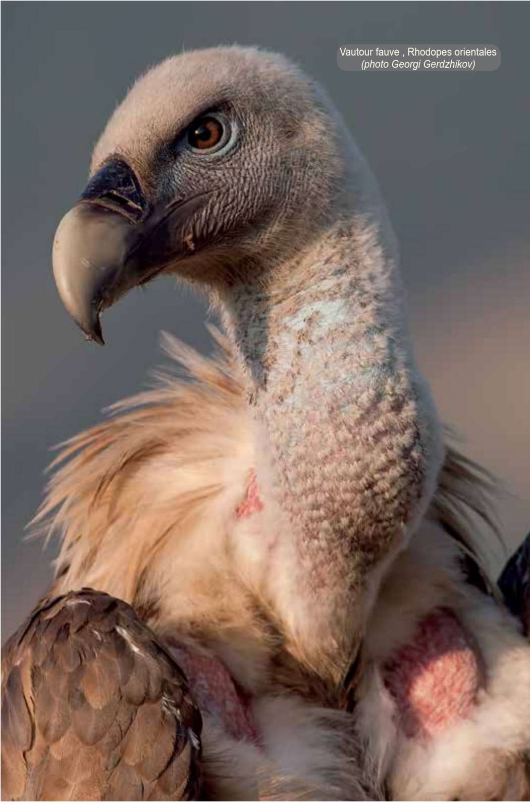
Vautour fauve , Rhodopes orientales