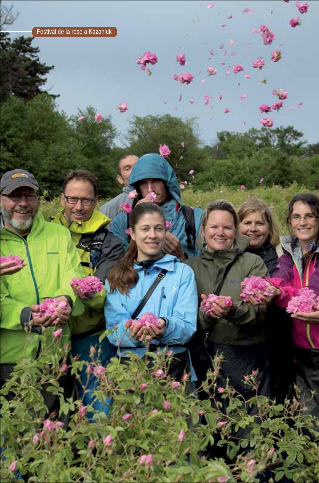
Festival de la rose a Kazanluk