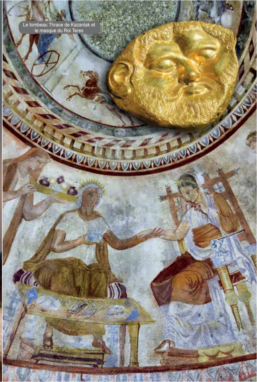
Le tombeau Thrace de Kazanlak et le masque du Roi Teres